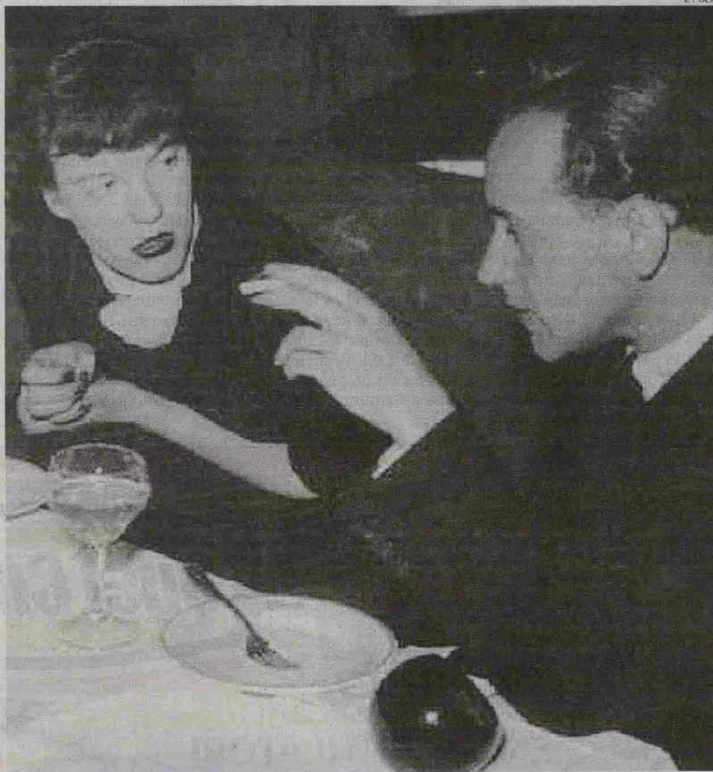
► Ingeborg Bachmann con Paul Celan